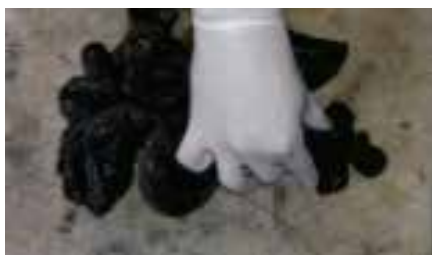
Fig. 3: Resección de intestino necrótico

Se decide intervención quirúrgica por sospecha clínica de invaginación intestinal. Se realiza laparotomía exploratoria con hallazgo de vólvulo de intestino delgado (íleon medio) el cual dentro presentaba invaginación ileo ileal. Se procede a reducir el mismo, pero se evidencian cambios necróticos ( figura 3) que imposibilita reducción, por lo que se realiza enterotomía+ des invaginación de aproximadamente 60 cm de íleon medio necrótico, el cual dentro contenía tumoración de aproximadamente 2" x 2".