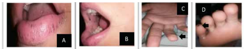
Fig. 4 A, B Labio y mucosa bucal con pigmentaciones mucocutáneas. C, D pigmentación en ubicaciones menos comunes - dedos de mano y pie.

Se realiza resección y anastomosis T-T ileo ileal en doble capa. Durante el postoperatorio la paciente presentó buena evolución, requirió nutrición parenteral hasta tolerar vía oral. En este caso el diagnóstico de Síndrome de Peutz-Jeghers se realizó por la evidencia al examen físico de lesiones hiperpigmentadas en mucosa oral (carrillos y labios) y en palma de las manos (ver ilustración 4) + masa intestinal enviada a patología cuyo reporte informa pólipo de Peutz-Jeghers infartado; degenerado y necrótico.