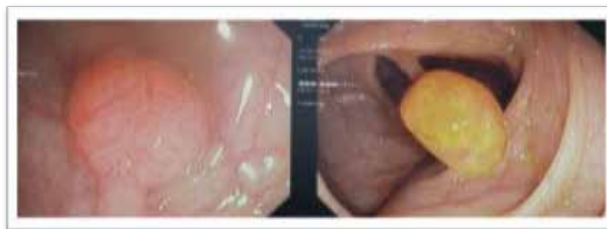
Fig. 2: A: pólipos sésiles en estómago de 3mm a 5mm de diámetro. B: Sobre curvatura menor pólipo de 8mm de diámetro con pequeño pedículo

Recto - Sigmoide: Pólipo hiperplásico, no se observa atipia, ni cambios malignos